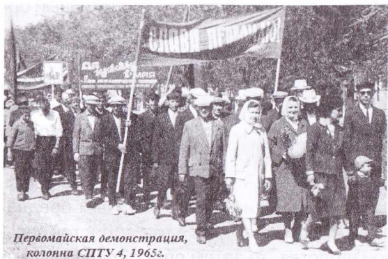
Первомайская демонстрация, колонна СПТУ 4, 1965г.