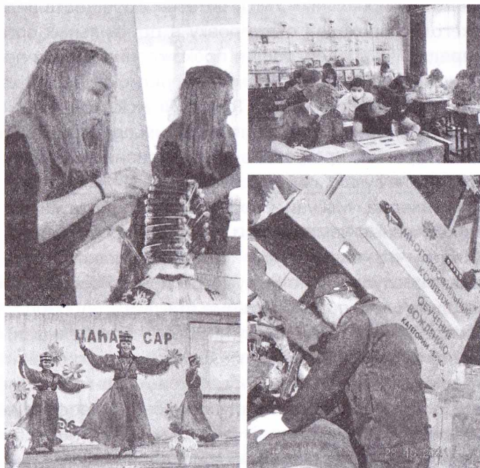
Студенчество – невероятно интересная, незабываемая пора