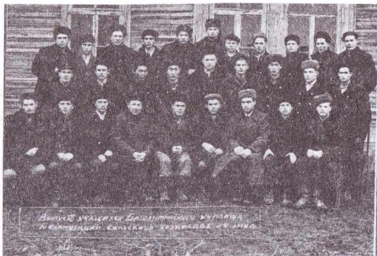
Делегаты учеников Банянинского училища и колхозники сельхозтехникума