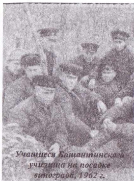
Учащиеся Банянинского училища на посадке винограда, 1962 г.