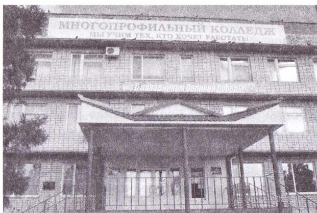
Современное здание колледжа, 2021 год