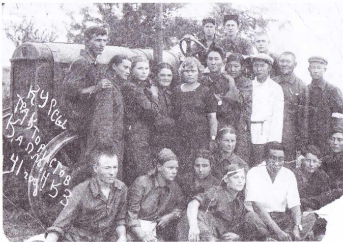
Первый набор Башантинской школы механизации, 1941 год

Шли годы, наше учебное заведение развивалось, менялись названия и рабочие стратегии. Если сначала главным предназначением была подготовка механизаторов и трактористов сельскохозяйственного производства, то затем спектр реализуемых профессий постепенно стал расширяться, и в 2013 году колледж приобрел свое современное название. К своему 80-летию он подошел как один из лидеров среднего профессионального образования Республики Калмыкии. Многопрофильный колледж реализует широкий комплекс образовательных программ: основные образовательные программы среднего профессионального образования – подготовка квалифицированных рабочих, служащих и специалистов среднего звена, дополнительные профессиональные и общеобразовательные (об-