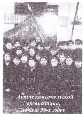
Актив комсомольской организации, начало 50-х годов