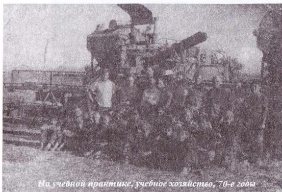
На учебной практике, учебное хозяйство, 70-е годы