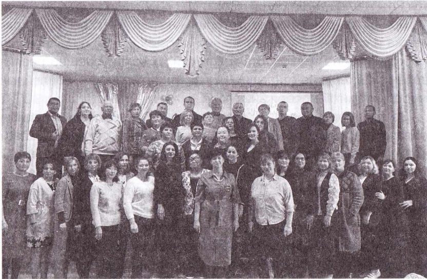
Педагогический коллектив колледжа, 2021 год

«Повар, кондитер», «сварщик», «мастер по ремонту и обслуживанию автомобилей», «мастер по обработке цифровой информации», «парикмахер», «бухгалтер», «воспитатель детей дошкольного возраста», «техник-механик», «техник-спасатель», «техник-технолог» – эти профессии, очень востребованные на рынке труда, сегодня получают в нашем учебном заведении более 600 студентов. Они продолжают славные традиции своих предшественников и повышают престиж колледжа, побеждая в региональных и всероссийских конкурсах, олимпиадах, конференциях, чемпионатах WorldSkills Russia, «Абилимпикс» и многих других соревнованиях. Наши студенты ежегодно становятся лауреатами премии главы Республики Калмыкии, поощряются стипендиями Правительства РФ.